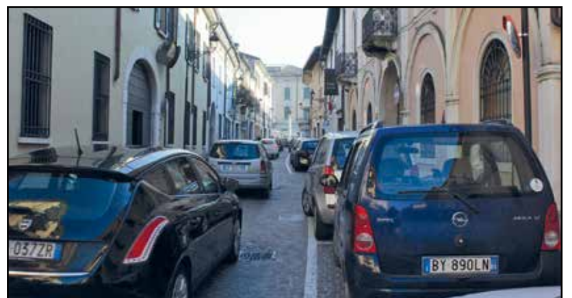
Pedoni, carrozzine e biciclette a rischio.