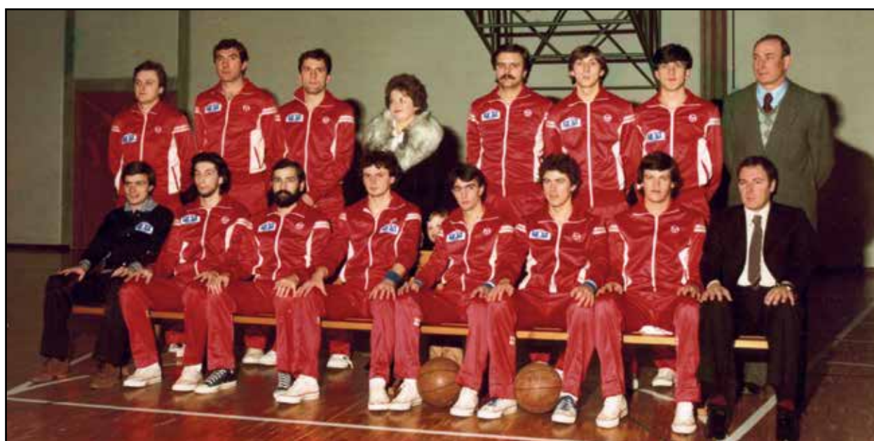
1978 Palestra Centro Giovanile squadra di basket R&D.

Uno sport che deve essere aiutato per il suo rilancio