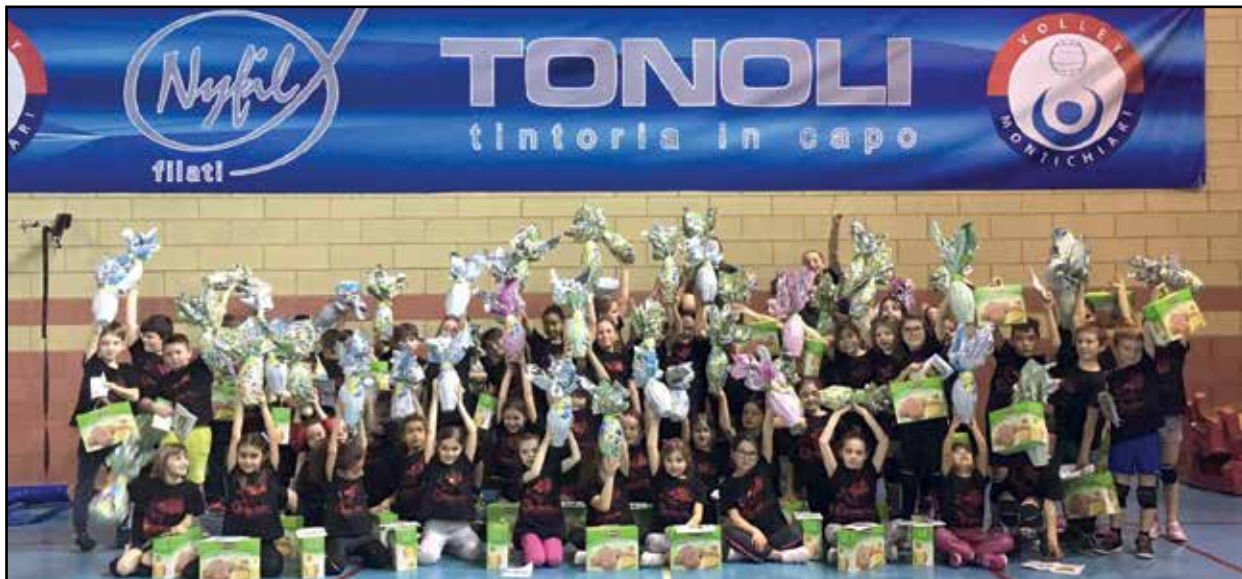
I partecipanti al torneo di pallavolo giovanile prima di Pasqua.

Appuntamento in piazza Santa Maria per sabato 26 maggio, in caso di pioggia al Palageorge per il torneo Top Volley rivolto a tutte le classi quarte di tutte le scuole elementari di Montichiari.