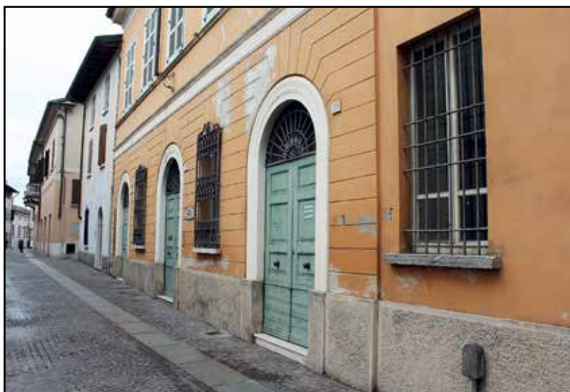
La sede dell'ex Biblioteca Comunale in via XXV Aprile n. 33.