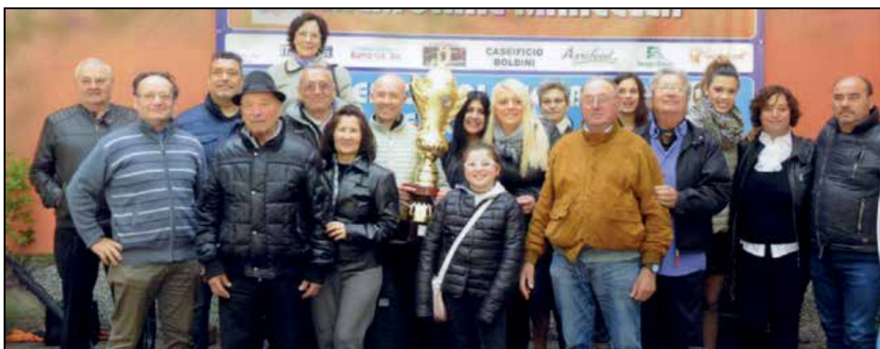
La famiglia Bregoli al gran completo nell'edizione del 2017.