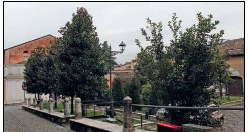
Piazza Teatro avvolta dal verde.